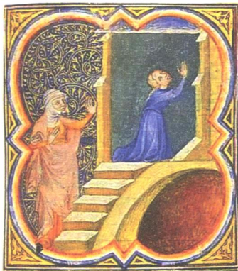
La vedova importuna (antica miniatura).

«Gesù raccontò una parabola sulla necessità di pregare con costanza senza scoraggiarsi». È quanto leggiamo nel Vangelo secondo Luca a proposito di un giudice che rimanda continuamente la causa avanzata da una vedova che vuole essere tutelata contro le pretese di un suo avversario. Ecco la parabola: «In una città viveva un giudice, che non temeva Dio né aveva riguardo per alcuno. In quella città c'era anche una vedova che andava da lui e gli diceva: "Fammi giustizia